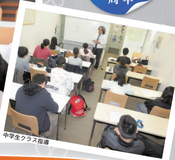
中学生クラス指導