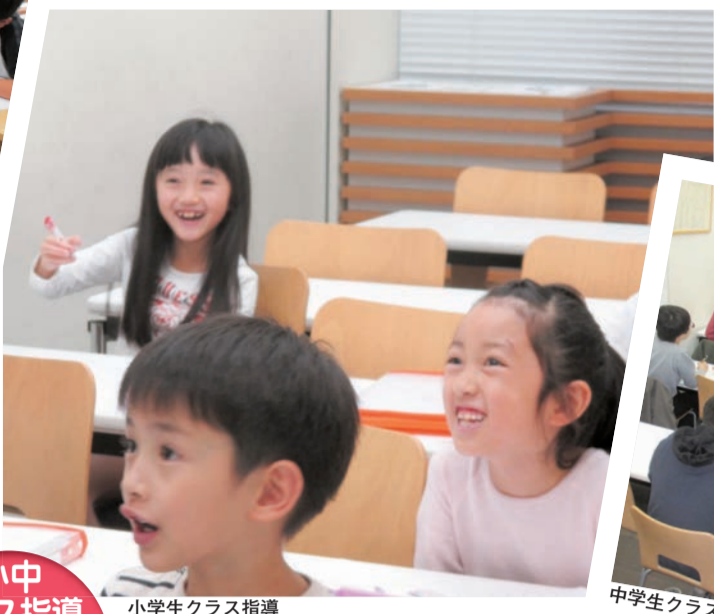
小学生クラス指導