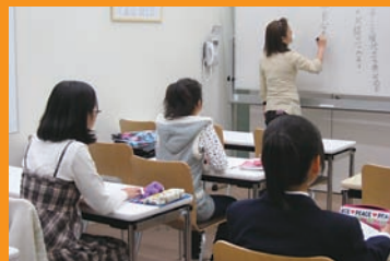
クラス授業の様子