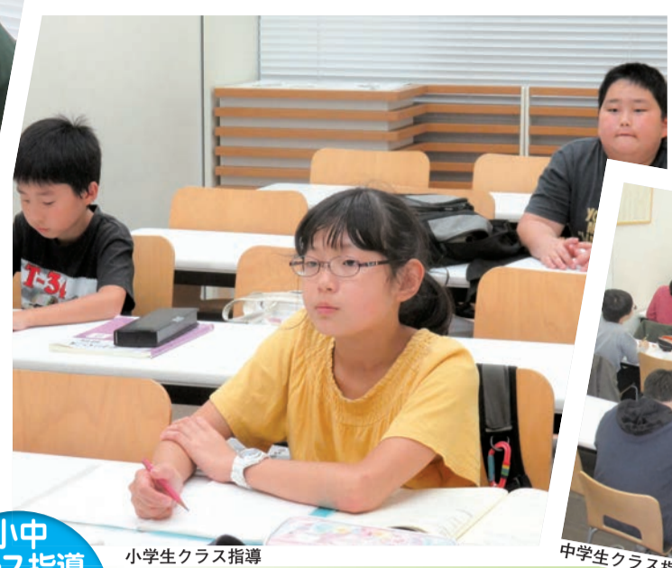
小学生クラス指導