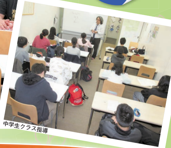
中学生クラス指導